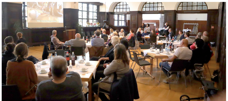
Ehrung im Rathaus Recklinghausen für besondere integrationsfördernde Leistungen in der Stadt

Die 17-Jährige fand mit ihrem hellen und schnellen Kopf ohne Probleme Arbeit und verdiente ihr eigenes Geld, kämpfte aber in den kommenden Jahren zunehmend mit ihren körperlichen Einschränkungen und Schmerzen. Sie musste mit 33 Jahren Rente aufgrund einer Erwerbsminderung beantragen.