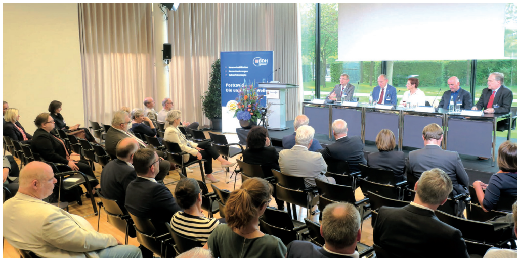
Der BDH kam 2022 mit Vertreterinnen und Vertretern aus Politik und Gesundheitsversorgung bei seinem 1. Parlamentarischen Abend in Berlin ins Gespräch.

Der BDH ist als Sozialverband für seine Mitglieder da, die in vielen Fällen Rat und Unterstützung benötigen. Das wäre aber