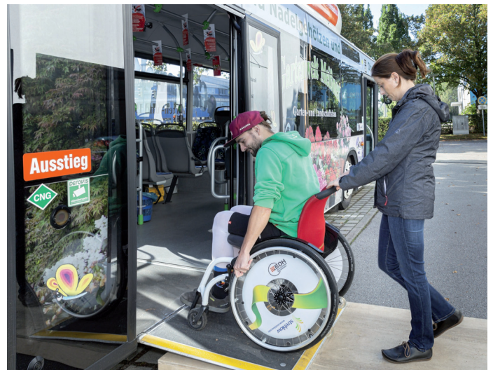
Üben an der Rollstuhlrampe des Busses der Verkehrsbetriebe.