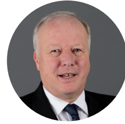
Peter Weiß Bundesvorsitzender BDH Bundesverband Rehabilitation

In diesen Tagen feiern wir Weihnachten, das Fest des Friedens. Diesen Frieden wünschen wir in diesen Tagen ganz besonders den Menschen in Russland und der Ukraine.