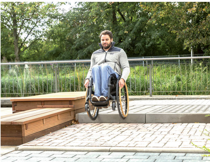
Der klinikeigene Trainingsparcours bereitet Rollstuhlfahrende auf Treppen und Kopfsteinpflaster vor.